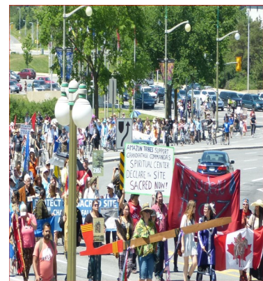
Des participants au cours, dont des membres du CAA, ont pris part à la